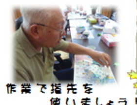
作業で指先を 使いましょう!