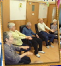
皆さんと音楽を 楽しみます♪