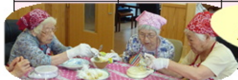
おやつ作り 頑張ってます!