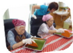
朝のリハビリ体操