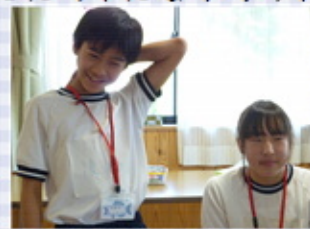
機能訓練 頑張ってます!