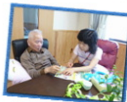
バラのアレンジ をしました!